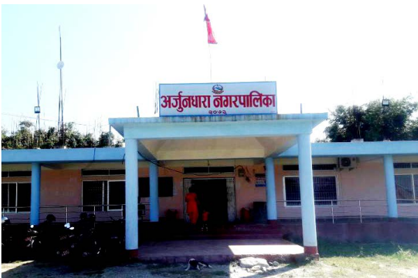
समुदायमा फैलिएपछि अर्जुनधारा गरेको छ । नगरको कोभिड क्राइसिस पुष्टि भएको थियो ।

अर्जुनधारा (प्रस) । नगरपालिकाले ५ दिनका लागि भापामा कोरोना संक्रमण नगरक्षेत्रमा लकडाउन गर्ने निर्णय