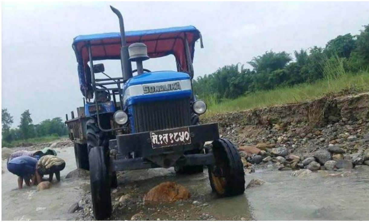
गोयाड खोलाबाट अवैध रूपमा ढुङ्गा उत्खनन् गरिँदै। सम्बन्धित निकाय बेखबर