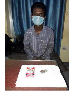
बिर्तामोड (प्रस) । बिर्तामोड नगरपालिका वडा नं. ३ सैनिकमोडबाट