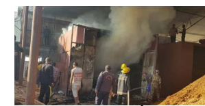
अनारमनी, १ नं. प्रदेश बिपद व्यवस्थापन गुल्म चन्द्रगढी र सशस्त्र बेस क्याम्प शनिश्चरेबाट संयुक्त प्रहरी टोली खटि गई दमक, भद्रपुर

वितामोड (प्रस) । मयुर प्लाई उत्पादन गर्दै आएको वितामोड नगरपालिका २ स्थित नमस्ते प्लाई प्याक्ट्रीमा आगलागी भएको छ । शुक्रबार बिहान ७.१५ बजेतिर फिट फेन नामक काठको मेटेरियल र सिलिङ चेम्बरमा आगलागी भएको हो । ईलाका प्रहरी कार्यालय