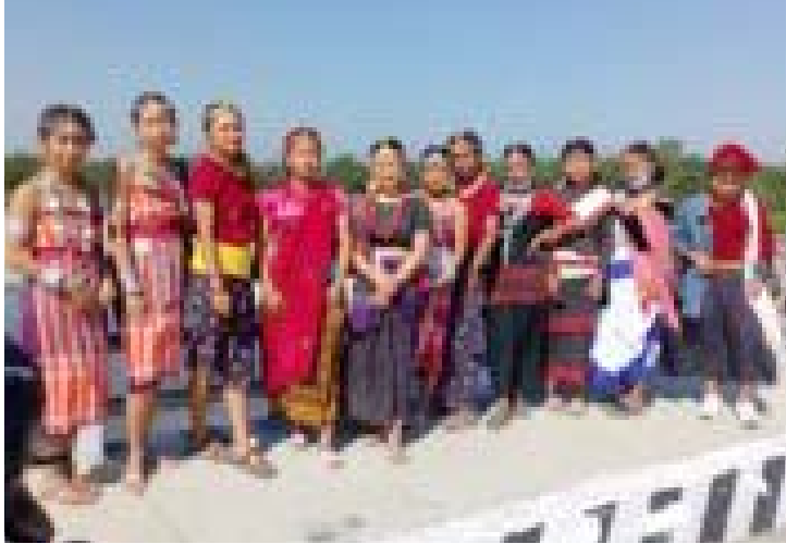
याकथुङ चुम्तुङमा विवाद देखियो । पछिल्लो समय राजवंशीहरूको जातीय

सामूहिकभन्दा पनि ब्यक्तिगत र राजनीतिक स्वार्थ हावी हुँदै गएपछि आदिवासी जनजातिका जातीय संस्थाहरूमा एकपछि अर्को गर्दै विवाद खडा हुन थालेको हो । सतारूढ नेकपामा जसरी पद र लोभलालचको निजी द्वन्द्व जारी छ, त्यसै छायो जातीय संस्थाहरूमा पर्न गएको हो । जाति समुदायको हकहित र उत्थानको लागि खोलिएका जातीय संस्थाहरूलाई पदाधिकारीहरूले निजी स्वार्थ परिपूर्ति गर्ने माध्यम बनाउन थालेपछि धेरै संस्थाहरूमा टकरावको अवस्था छ । धिमालहरूको जातीय संस्था धिमाल जातीय विकास केन्द्रको विवाद नसिल्टिदे लिम्बुहरूको संस्था किरात