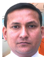
डा. मिश्र परिचार

विगत दशकका अभूतपूर्व राजनीतिक तथा कानुनी परिवर्तनका बाबजुद छुवाछुत र जातिभेदका समस्या किन अपेक्षाकृत कम भएनन् ? अब कस्तो नीति वा व्यवस्था स्थापित गरेमा दलितले मुक्तिको सास फेर्न पाउला ? यस्ता प्रश्नहरूले सरोकारवालाहरूको मन पिरोलिएको छ। अधिकांश दलित बौद्धिक तथा अभियन्ताहरू सोच्दछन् कि कानुनको प्रभावकारी कार्यान्वयन भयो भने जातीय उत्पीडन न्यून गर्न सकिन्छ। त्यही चिन्तनका कारण अभियन्ताले एक प्रकारले 'दमकल अभियान' चलाइरहेका छन्। जहाँ घटना घट्यो त्यहाँ पुग्नु, सामाजिक सञ्जालमा कुर्लन्छन् र बिस्तारै थिचिन्छन्। यो तर्क र शैली आफैमा नराम्रोसाथै होइन। कानुनीराजको प्रत्याभूतिका लागि सबैले सक्दो प्रयास गर्नेपर्छ। यसरी समस्याको जरासम्म पुगिन्। यो तरिकाले मात्रै लामो समय समाजमा जरा गाडेको जात व्यवस्था भाँचिन्, सामाजिक संरचना भत्किँदैन।