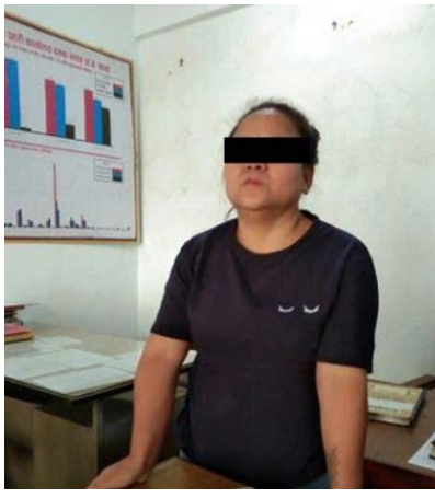
३९ वर्ष उमेर समूहका ८ जना महिला तथा युवतीहरू फेला पारी उद्धार गरेको थियो । उनीहरूलाई