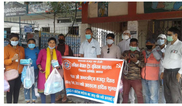
महासंघले वितरण गरेको पर्चामा मास्क अनिवार्य प्रयोग गरी, सावुन पानीले बेलाबेलामा राम्रोसँग हात धुने, कोभिडको लक्षण देखिएका परीक्षण गराउने र क्वारेन्टाइनमा बस्ने, सामाजिक दुरी कायम गर्ने, भीडभाडबाट बच्ने, अतिआवश्यक कामबाहेक घरबाट बाहिर नजाने, सेनिटाइजरको प्रयोग गर्नेलाग्यत रहेका छन् ।