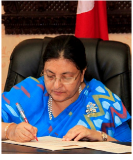
गराउन राष्ट्रपतिसमक्ष सिफारिस