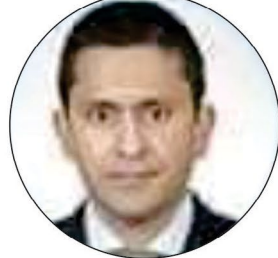
ई.रविमुष्ण मा महासचिव