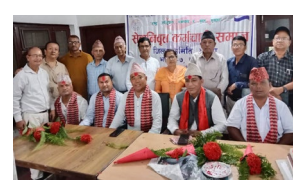
भापाद्वारा भद्रपुरका नगर प्रमुख

भद्रपुर (प्रस) । भद्रपुर नगरपालिकामा नेपाली काँग्रेसका तर्फबाट निर्वाचित नगर प्रमुख तथा वडाध्यक्षलगायतका जनप्रतिनिधिलाई सम्मान गरिएको छ । सेवा निवृत्त कर्मचारी समाज