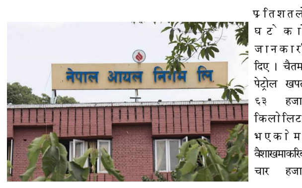
फरक पर्ने जनाएको छ । जेटमा भने घटेर ५९ हजार किलो लिटरमा झरेको छ । सरकारले इन्धन खपत कम गर्न भन्दै आइतबार पनि सार्वजनिक विदा दिने निर्णय गरेको र सो नियम जेट महिनासम्म मात्र लागू भएको थियो । सरकारले असार १ देखि आइतबारको विदा कटौती गरेको छ ।

भाषा (प्रस) / नेपाल आयल निगमले जेट महिनामा आइतबार विदा गर्दा पेट्रोलको खपत ११ प्रतिशतले घटेको जनाएको छ । सोमबार इन्धनको मूल्यवृद्धिबारे जानकारी दिन आयोजित पत्रकार सम्मेलनमा निगमका कार्यकारी निर्देशक उमेशप्रसाद थानीले गत वैशाख महिनाको तुलनामा गत जेट महिनामा पेट्रोलको खपत ११