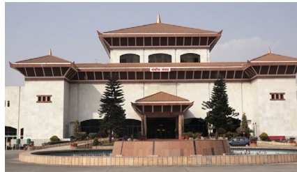
प्रमुख प्रतिपक्ष एमालेका ८ जना सांसदले बलात्कारसम्बन्धी प्रचलित हदम्यादसम्बन्धी कानुनी व्यवस्थालाई हटाउने गरी कानुनी

व्यवस्था गर्न संशोधन प्रस्ताव दर्ता गरेका हुन् । मूल ऐनको दफा २२ ९ मा संशोधन गरी जबरजस्ती करणीजस्तो जघन्य अपराधको हकमा उजुरीका लागि राखिएको हदम्यादको व्यवस्था हटाउनु पर्ने काँग्रेस सांसदहरूको संशोधन प्रस्तावमा उल्लेख छ । यसअघि दर्ता भएको पाण्डे समूहको प्रस्तावमा पनि सोही आशय व्यक्त गरिएको छ ।