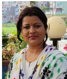
• कर्ना केसी

आध्यात्मिक परिभाषाअनुसार मन र आत्मालाई परमात्मसँग जोड्ने क्रियालाई योग भनिन्छ। शारीरिक रूपमा स्वस्थ, मानसिक रूपमा शान्त र आध्यात्मिक रूपमा उच्च चेतनायुक्त भएर जिउने कलालाई पनि योग भनिन्छ। संस्कृत भाषामा योगलाई जोड्नु भन्ने बुझिन्छ। योग नेपालको हिमालय क्षेत्रमा जन्मिएर उत्तरमा चीन र दक्षिणमा भारत हुँदै विश्वभरि फैलिएको कला, संस्कृति र विज्ञान हो।