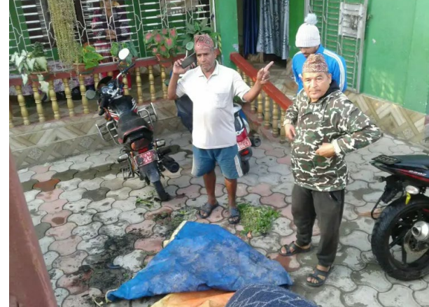
पुर्‍याएको छ । सिर्जेशरील सरस्वती मार्गमा रहेको राधाकृष्ण

आगो बलेको देखेको र मोटरसाइकलको पछाडिको भाग जलिरहेको अवस्थामा आगो नियन्त्रणमा लिन थप क्षति हुन पाएन ।