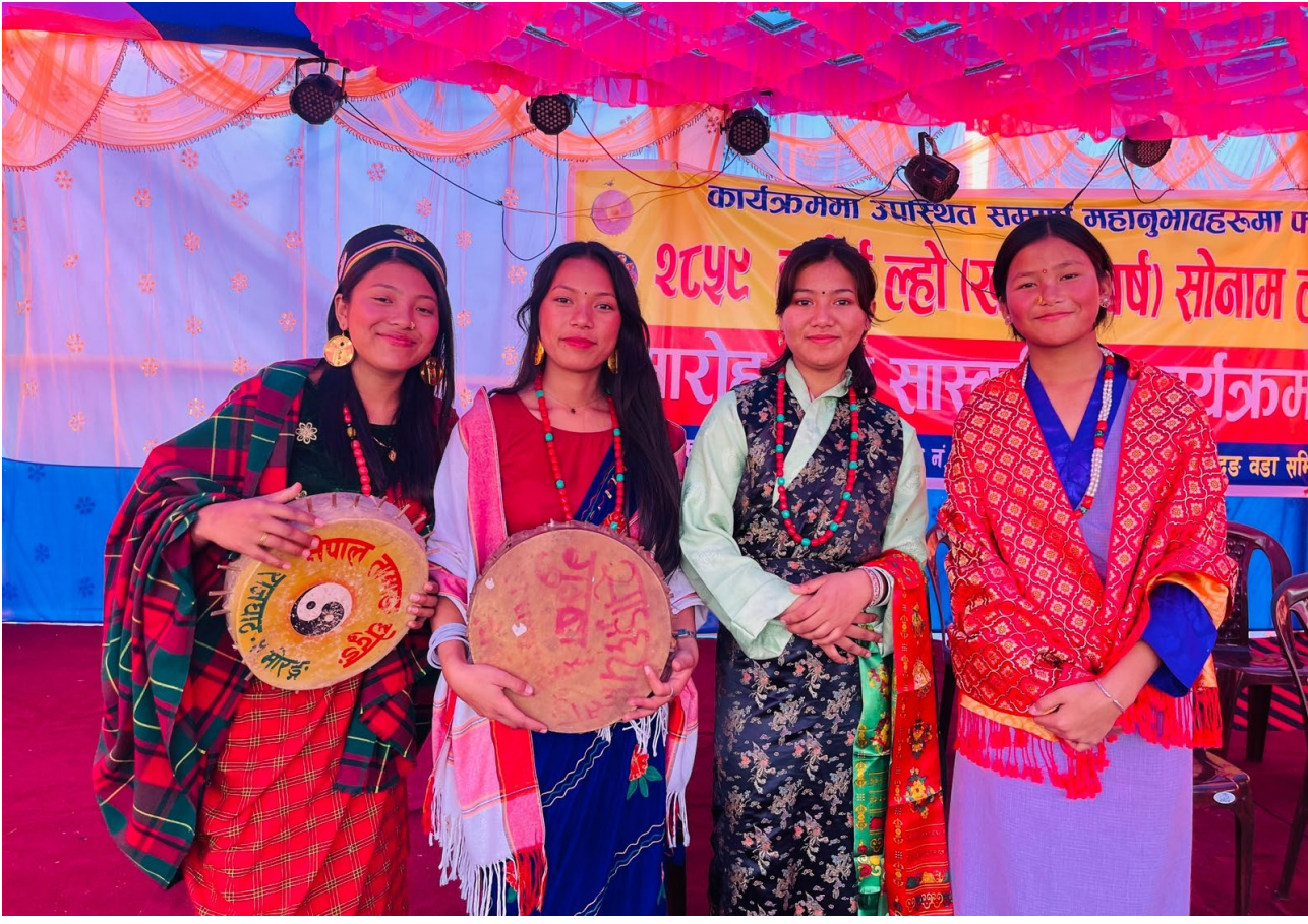
हाम्रो पहिचान, हाम्रो संस्कृति -मोरङको उर्लाबारी-९ दुर्गापुरीमा आयोजित सोनाम ल्होसार २८५९ अवसरमा आयोजित ५ दिने सांस्कृतिक कार्यक्रममा परम्परागत जातीय पोशाकमा सजिएका तामाङ समुदायका युवतीहरू ।(तिस्वर तेजन् खड्का)