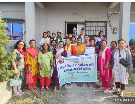
कमजोर नटान सुभाष दिए।

बिर्तामोड (प्रस)। दलित समुदायका महिलालाई लाेक्षित गरि बिर्तामोड नगरपालिका वडा नं. १० मा सञ्चालित नेतृत्व विकास तथा उद्घोषण कलासम्बन्धी तीनदिने तालिम सोमबारसम्पन्न भएको छ।