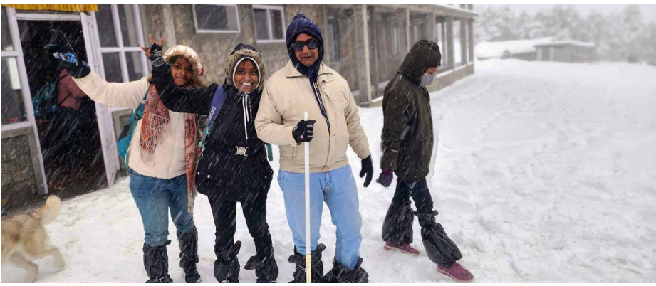
हिमपात : ३ हजार ७ सय ९४ मिटरको उचाईमा रहेको ताप्लेजुडस्थित पाथीभरा क्षेत्रमा लामो समयपछि हिमपात भएको छ । हिउँले पाथीभरा मन्दिर र आसपासका क्षेत्र छपक छोपेको छ । त्यस्तै इलामको सन्दकपुरमा पनि हिमपात भएको छ । हिउँले ढाकिएको पर्यटकीय गन्तव्य सन्दकपुरमा पर्यटकहरु रमाइरहेका छन् ।