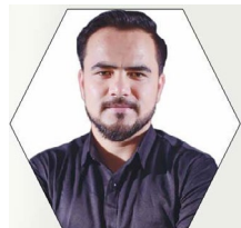
• जगदीश एर

संघीय र प्रदेश संसद् तथा स्थानीय तहमा युवाको प्रतिनिधित्व बढ्दो छ । स्थानीय तहमा ४१.१४ प्रतिशत, प्रदेशमा २१ प्रतिशत र संघीयमा १३ प्रतिशत युवा निर्वाचित भएका छन् । यसबाट राज्यको नीतिनिर्माण तहमा युवाको पहुँच र सहभागिता उल्लेख्य रूपमा बढेको देखिन्छ । सरकारको विगत चार वर्षको बजेटलाई हेर्ने हो भने युवालाई विशेष ध्यान दिइएको छ ।