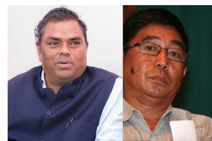
जेठ ८ गते दुवै पक्षलाई