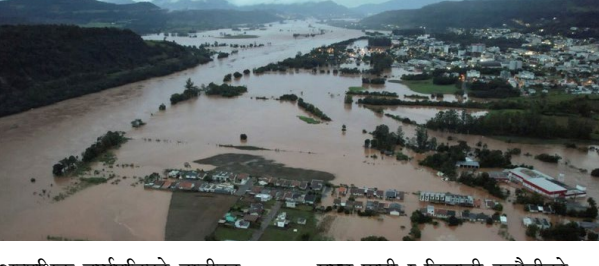
अत्यधिक वर्षापछिको बाढीका कारण ५ लाखभन्दा बढी मानिसले सफा पानी र बिजुली कटौतीको सामना गर्नुपरेको बताइएको छ।

एजेन्सी । ब्राजिलमा अत्यधिक वर्षापछिको बाढीमा परी कम्तीमा ५५ जनाको मृत्यु भएको छ। ७४ जना बेपत्ता छन्। शनिबारदेखि भइरहेको भारी वर्षापछि २५ हजारभन्दा बढी मानिस विस्थापित भएको अधिकारीहरूले जनाएका छन्। अझै केही दिन वर्षा हुने चेतावनी त्यहाँको मौसम विभागले दिएको छ।