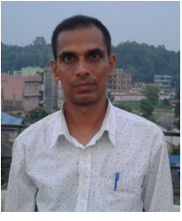
• द्रोण अधिकारी

जलवायु परिवर्तनको असर हरेक वर्ष देखिन थालेको छ। जाडो वा गर्मीको समयमा विगतभन्दा भिन्न रूपमा प्रकृतिले आफूलाई प्रस्तुत गरिरहेका विपतको रूप देखिन थालेको अवस्था छ। खासगरी प्रकृतिलाई मानिसले नियन्त्रण गर्ने प्रयास थालेकै कारण विपत नयाँ नयाँ स्वरूपमा आउने गरेको छ। सत्य कुरा के हो भने प्रकृतिमाथि मानिसको नियन्त्रण संभव छैन तर पनि मानिस विकास वा उन्नतिका नाममा प्रकृतिमाथि अतिक्रमण बढाइरहेको छ। प्रकृतिलाई मानिसले नियन्त्रण गर्न नसके पनि सही रूपमा उपयोग गर्न भने सक्छ। प्रकृति मानवका लागि सुखमय जीवन पनि हो तर, मान्छे आफ्नो जीवनका रूपमा रहेको प्रकृतिमाथि अतिक्रमण गरेर विजय हासिलको दौडमा लाग्दा प्रकृतिले प्रकोपको स्वरूप धारण गर्ने गरेको छ। प्राकृतिक प्रकोप भन्नाले बाढी, पहिरो, वर्षा, खडेरी, हिमपात, हुरीबतासजस्ता कुराहरू पर्दछन्। प्राकृतिक प्रकोप मानिसहरूको बशमा हुँदैन तर मानिसले चाहेमा यसको न्यूनीकरण गर्न सक्छ। धनजनको क्षतिबाट जोगाउन सक्छ। प्राकृतिक प्रकोपको ख्याल गर्नु हो भने यसले धनजनको