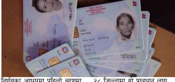
निर्णयका आधारमा पहिलो चरणमा २८ जिल्लामा यो प्रावधान लागू

भापा(प्रस) । राष्ट्रिय परिचयपत्र तथा पञ्जीकरण विभागले साउन १ गतेदेखि २८ जिल्लामा सामाजिक सुरक्षा भत्ता नवीकरण गर्न राष्ट्रिय परिचयपत्र अनिवार्य गरेको छ । राष्ट्रिय परिचयपत्र तथा पञ्जीकरण विभागले जारी गरेको सूचना अनुसार मन्त्रीपरिषद्को २०८१ जेठ २४ गतेको बैठकले गरेको