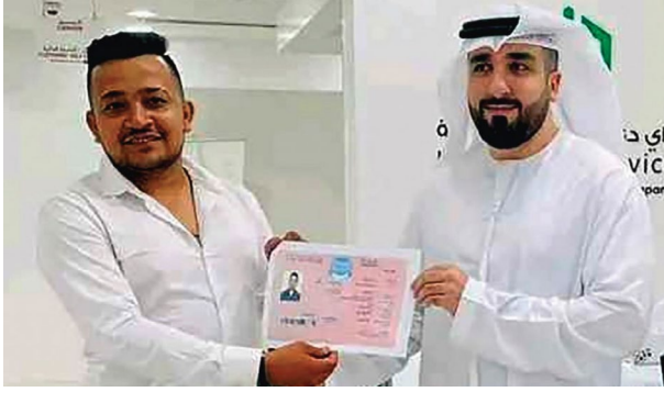
व्यवस्थासहित १० वर्षका लागि

यो भिसा 'असाधारण प्रतिभा' भएका यूएईका स्वदेशी तथा विदेशी नागरिकले स्थायी बसोबासको