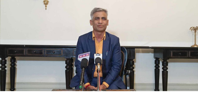
दोहोर्न्याएका छन् । सामाजिक सञ्जाल फेसबुकमा आइतबार