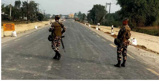
भापा(प्रस) । पूर्व-पश्चिम राजमार्गअन्तर्गत मोरङको सुन्दरहैचा नगरपालिका-७ स्थित मालती पुलनजिकै

फेला परेकामध्ये एटा सिलिन्डर बम डिस्पोज गरिएको छ । नेपाली सेनाको टोलीले बम डिस्पोज गरेको हो । बाँकी तीनवटा बम क्रमशः डिस्पोज गरिने छ । बम रहेको हल्ला चलेपछि खोजीका लागि पूर्वपश्चिम राजमार्ग खण्डमा नेपाली सेना र नेपाल प्रहरीको टोली परिचालन गरिएको थियो ।