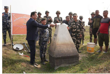
सीमा स्तम्भहरूको मर्मत कार्यको शुभारम्भ मेचीनगर न.पा. १५ सिसुवाडाँगी स्थित सानो सीमा स्तम्भ नं. ९५/१२ बाट गरिएको हो।

भापा(प्रस)। सशस्त्र प्रहरी बल नेपालले सीमा स्तम्भलाई मर्मत गर्न थालेको छ। बिहीवारबाट सशस्त्र प्रहरी बल नेपाल नं. २ गण हे.क्वा. भ्रमणले भापा जिल्लाअन्तर्गत नेपाल-भारत अन्तर्राष्ट्रिय सीमामा रहेका सीमा स्तम्भहरूको मर्मत थालेको हो। सीमा स्तम्भमध्ये बीडब्लुजीको निर्णयानुसार सन् २०१४ पश्चात् निर्माण भएका नेपालतर्फबाट मर्मत संभार गरिने बिजोर नम्बरका