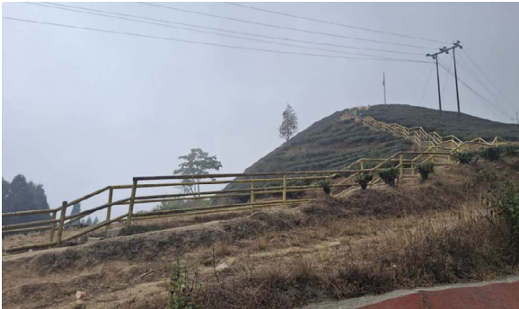
देउमाई नगरपालिकाको पानीटार, इलाम नगरपालिकाको इलाम बजार क्षेत्र सुनसान

ताप्लेजुङ पाथीभरा मन्दिरमा केबुलकार निर्माण र त्यसपछि उत्पन्न विवादपछि गरिएको बन्दले इलामका प्रमुख पर्यटकीय स्थल अन्तु, कन्यामसहितका क्षेत्र सुनसान बनेका हुन् । लगातारको बन्दका कारण मेची राजमार्गमा यातायात सञ्चालन हुन नसक्दा पर्यटक आउन छाडेका छन् । सूर्योदय नगरपालिकाको कन्याम, अन्तु, रोङ गाउँपालिकाको सानो पाथीभरा मन्दिर, सन्दकपुर गाउँपालिकाको सन्दकपुरडाँडा,